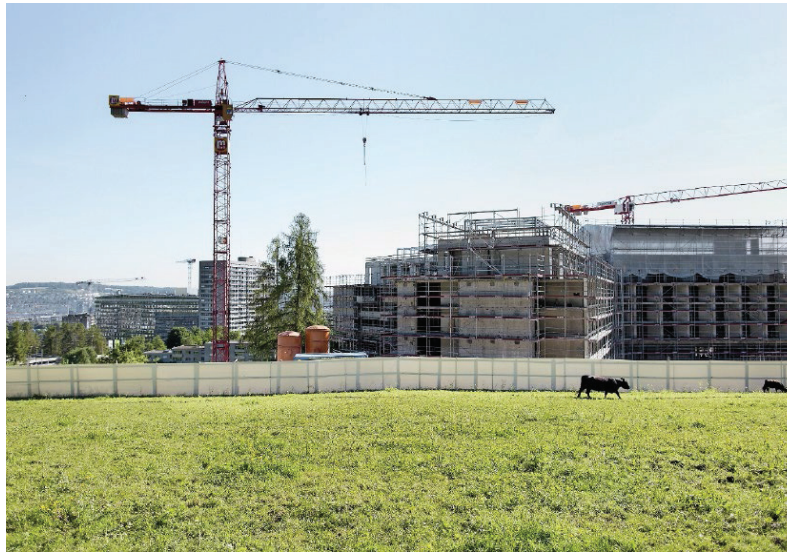
Baugebiet und Nichtbaugebiet sind nicht überall so sauber getrennt wie beim Zürcher Triemli.

Die Studie ortet weitere Fehlanreize: ● Erschliessung: Der Staat ist nicht verpflichtet, Häuser ausserhalb der Bauzonen zu erschliessen. Die Kosten dafür muss der Grundeigentümer tragen. Gleichwohl beteiligt sich der Staat in gewissen Fällen an der Finanzierung. So etwa kann er ein öffentliches Interesse geltend machen, etwa ein Haus zum Schutz der Umwelt an die Kanalisation anzuschliessen sei. Oder aber er finanziert in der Bauzone Zufahrtsstrassen, welche den Grundeigentümern eine Feinerschliessung im Nichtbaugebiet ermöglichen. Die Studie taxiert solche Hilfen als «problematisch», weil ein Teil der Erschliessung so durch Steuergelder subventioniert werde. Im Kanton Luzern etwa steuern private Grundeigentümer zumeist 40 bis 50 Prozent der Kosten bei, den Rest übernimmt die öffentliche Hand. Studienleiter Markus Gmünder regt daher eine konsequenterer Um-